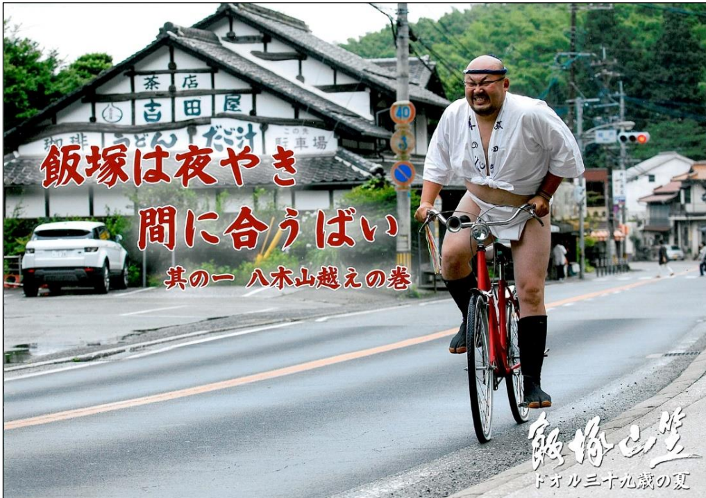
2015年 最優秀賞作品(組作品6枚の内の1枚)